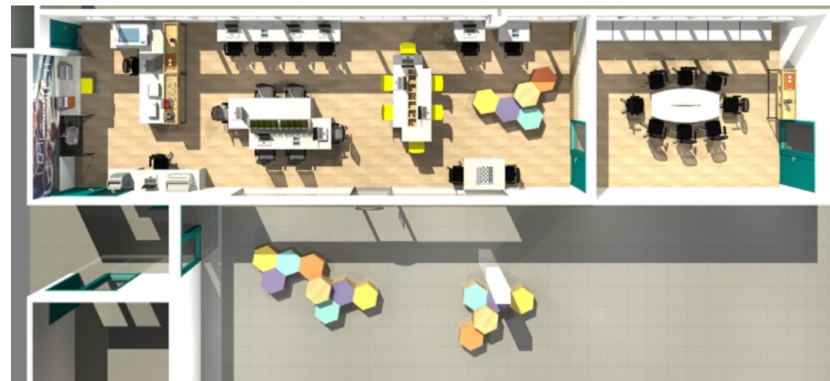
PLANTA BAIXA LABORATÓRIO DE INOVAÇÃO ESCALA 1/65